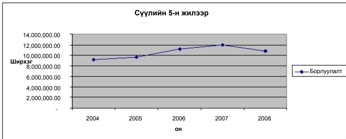
График 1 : Сүүлийн 5-н жилийн борлуулалтын хэмжээ / Монголд /

Монголын зах зээл дээр сүүлийн 5-н жилийн байдлаар худалдаалагдсан ажлын бээлийний борлуулалыг график 1-р харуулав.