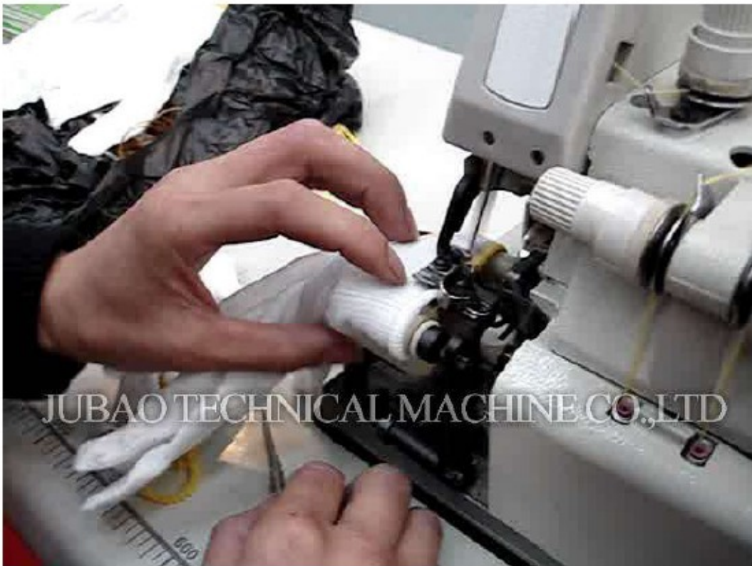
Будганд дүрэгч машин