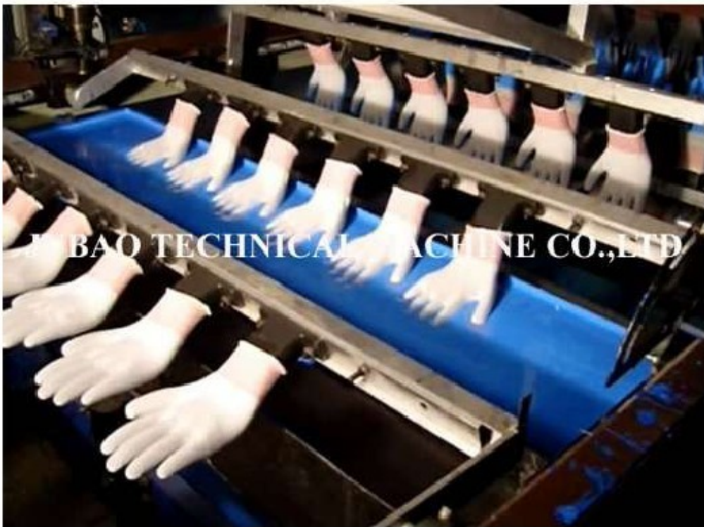
Будаг хатаагч машин