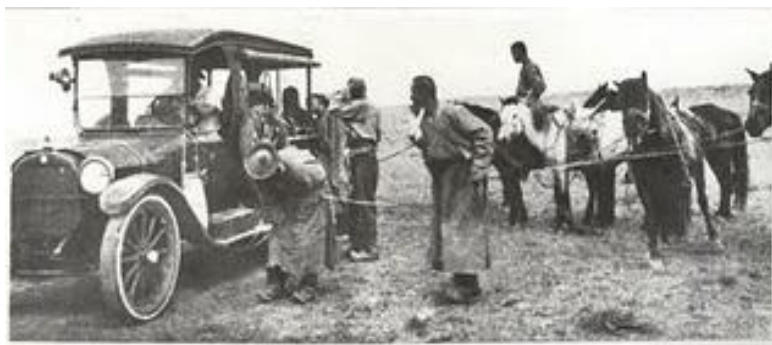
Уламжлалт унаа “моридууд” ба шинэ унаа “машин”.

Энд яриж буй сэдэвүүдийг нухацтайгаар бас дэлгэрүүлэн бодоход яагаад орчин үе ирэх гүй алдагдсаны гол эзэн хэн бэ гэвэл Ар Монголын үндсэн хуулийг л хэлэхээс өөр зам үгүй. Шинэ төр шинэ Монгол хүний гарц бол шинэ үндсэн хуулийг л хийх тэр ариун үйлс гэдгийг л олж харах явдал.